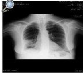
Figura 1 Radiografía n.º 1 (09-04-2008)

En esta radiografía destaca un infiltrado en el lóbulo inferior derecho, con discreto derrame pleural ipsilateral. El cuadro clínico, junto con los hallazgos radiológicos y analíticos, es consistente con el diagnóstico de neumonía adquirida en la comunidad.