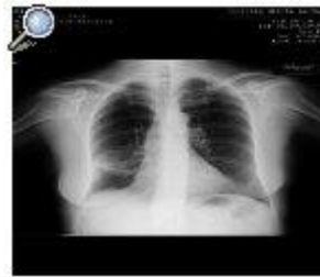
Figura 2 Radiografía n.º 2 (15-04-2010).

Normalmente, cuando una paciente ingresa en neumología, se realiza para control evolutivo radiografía de tórax y analítica sanguínea a los 10 días del diagnóstico de la neumonía. Pero, en este caso, como la paciente no ingresó, le indiqué que volviera a los 5 días para nueva valoración clínica, repetir analítica y radiografía. Siendo los resultados los siguientes (fig. 2):