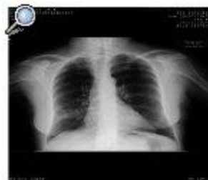
Figura 3 Radiografía n.º 3 (19-04-2010).

A los 10 días, se le volvió a repetir la radiografía, siendo completamente normal (fig. 3):