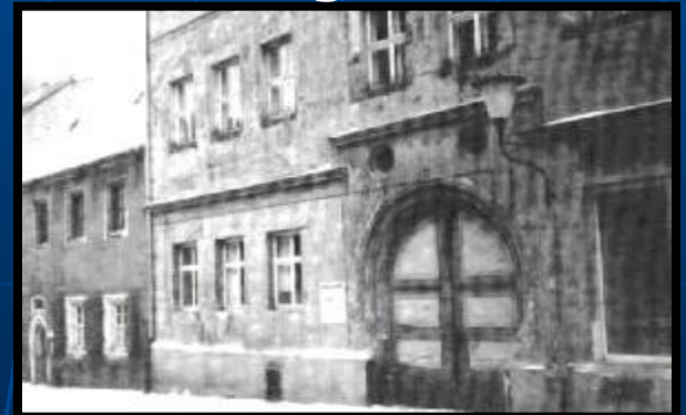
Casa de Hahnemann en Torgau