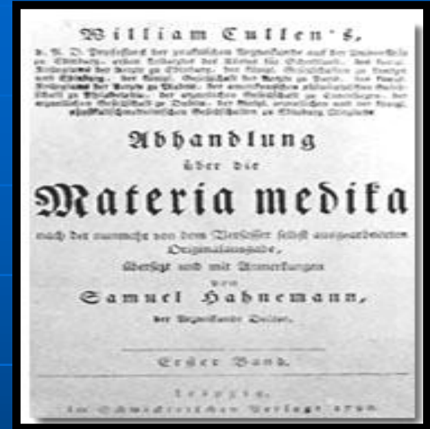
Materia medica de Cullen 1790

• Molschleben 1794 Existe poco tiempo la clínica , muere el príncipe Ernst y Hahnemann llega aquí , se dedica por completo a la escritura , "Amigo de la salud II" y el famoso "lexicon farmaceutico".