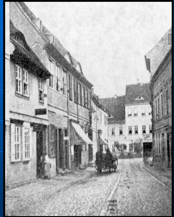
Farmacia del moro en Dessau

• 1801 va a Machern después a Eilenburg donde por primera vez en mucho tiempo pone un consultorio grande y por celos de otros médicos abandona para ir en 1803 a Wittenberg , 1804 Dessau