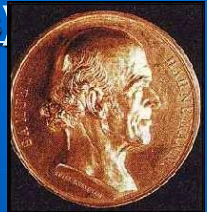
1835 Paris medalla conmemorativa del 80 aniversario