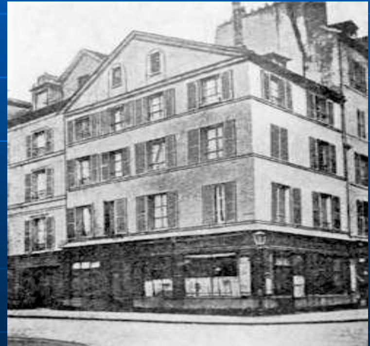
Calle Milán #1 Paris