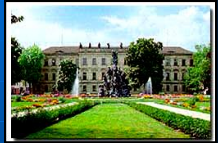
UNIVERSIDAD DE ERLANGEN