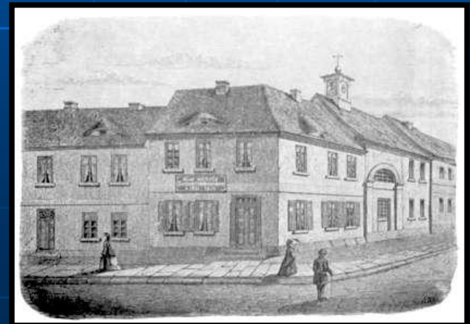
RESIDENCIA DE HAHNEMANN EN KÖTHEN