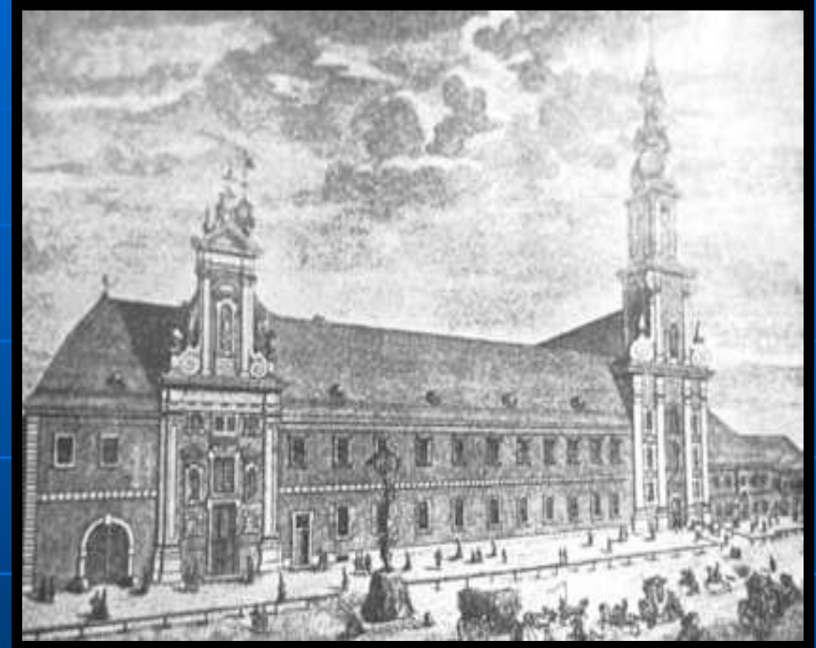
HOSPITAL HERMANOS DE LA MISERICORDIA