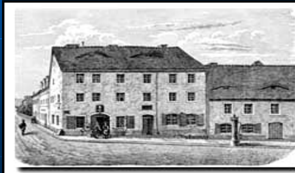
"CASA DE LA ESQUINA"