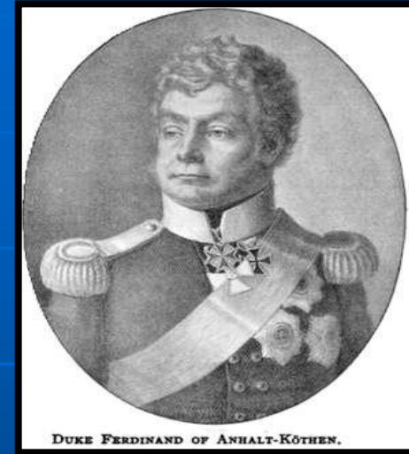
Duque Ferdinand de Anhalt