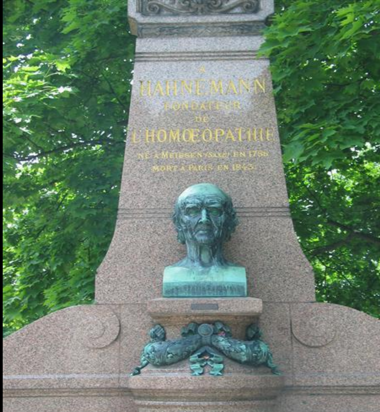
Su tumba en el panteón Peré Lachaise en París