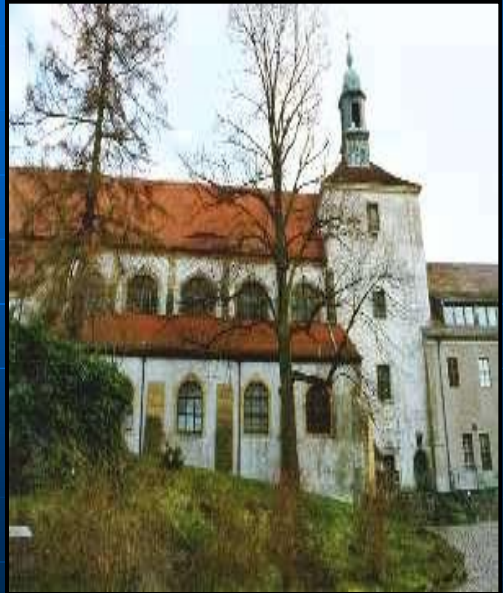
IGLESIA DE SAINT AFRA