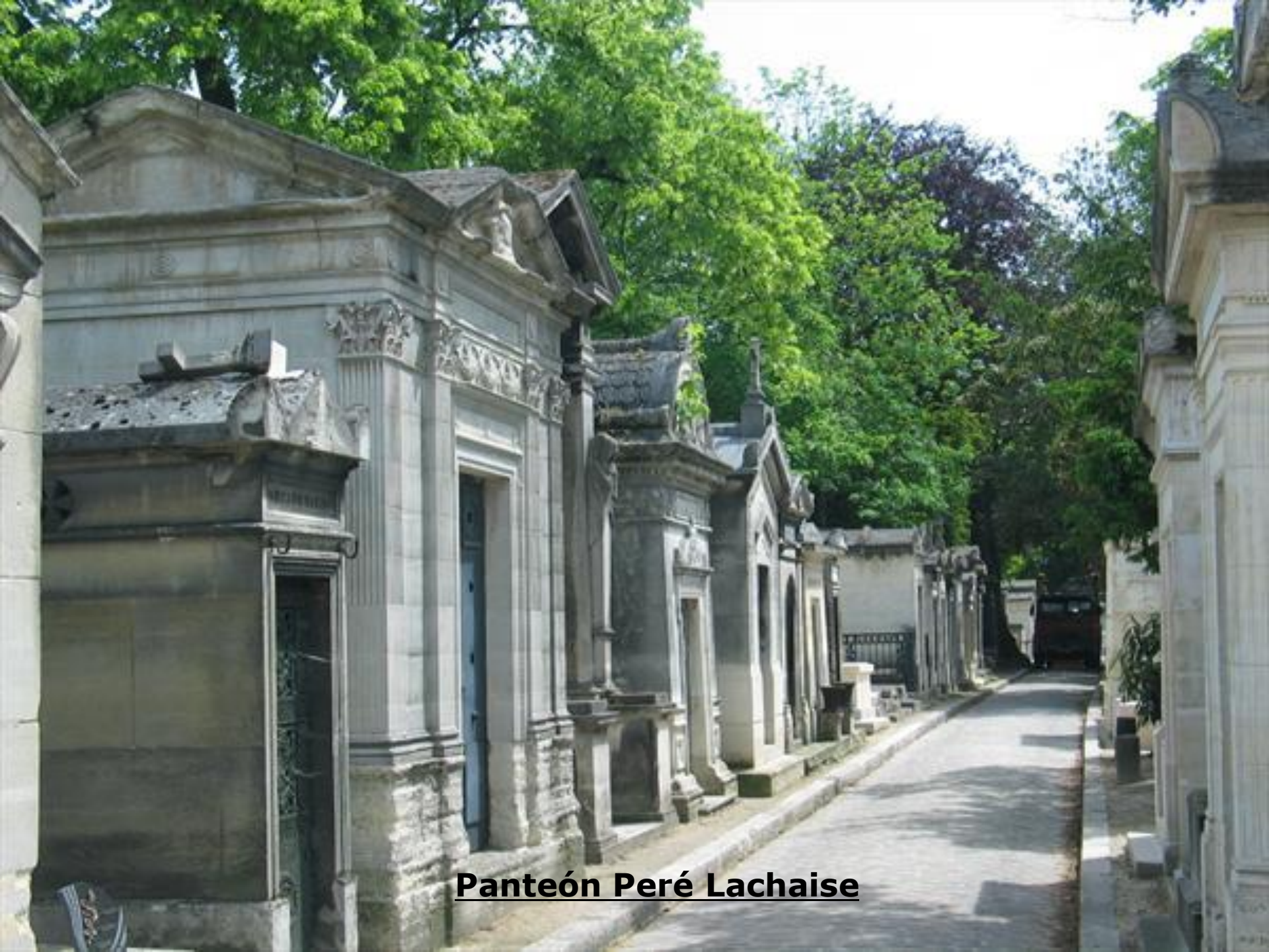
Panteón Peré Lachaise