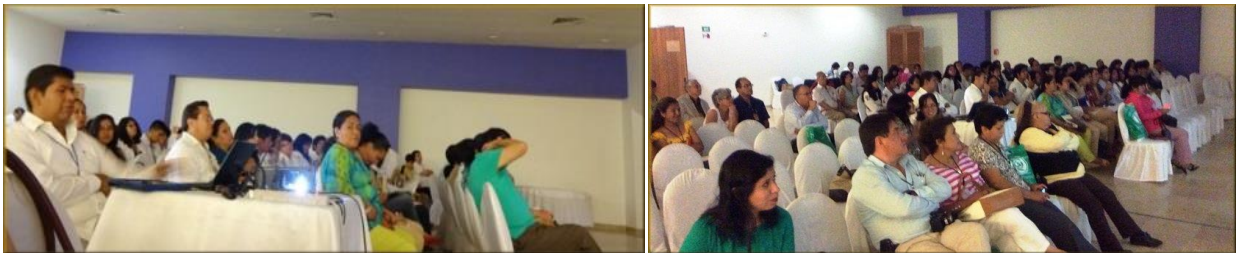
Imagen 1: Público presente a la Cuarta Jornada Médica y Tercer Seminario de Medicina Homeopática

Siendo las 08:30 horas se da inicio la inscripción al evento con una gran afluencia de jóvenes estudiantes de la Escuela Nacional de Medicina y Homeopatía del IPN; de la Escuela Libre de Homeopatía de México IAP; de la facultad de medicina "Miguel Alemán Valdés" de la Universidad Veracruzana; de la facultad de Medicina de la Universidad Cristóbal Colón y de la Universidad del Valle de México de Veracruz. También contamos con la presencia de médicos homeópatas de la República Mexicana (ver imagen 1) que se dieron cita para enriquecer sus conocimientos de la experiencia de los ponentes.