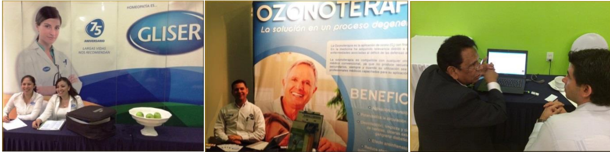
Imagen 23: Laboratorios Homeopáticos GLISER, Rubio Pharma y Q-Kent

evento anual de nuestro Colegio dieron un realce al mismo por lo que agradecemos su confianza y presencia así como el apoyo otorgado (ver imagen 23).