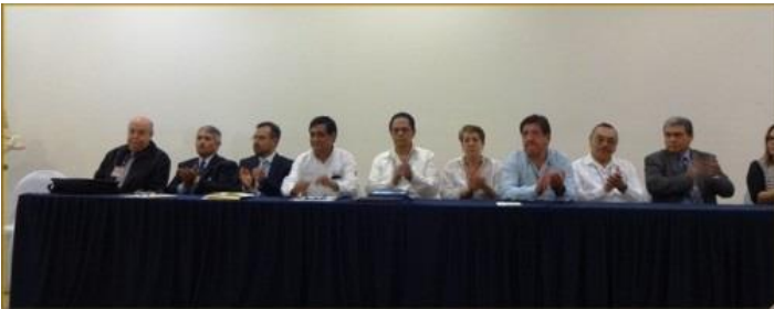
Imagen 2: Invitados a la Mesa de Honor

Como estaba programado a la 10:30 horas se instalaron las personalidades invitadas en la mesa de honor (ver imagen 2) para inaugurar esta CUARTA JORNADA MEDICA Y TERCER SEMINARIO DE MEDICINA HOMEOPÁTICA.